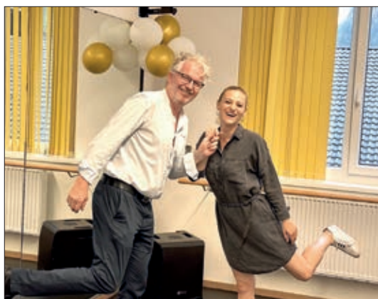
Eröffnung der neuen Tanzschule.

September 2023 zur gewerblichen Vermietung unter www.fil-home.at zur Verfügung steht, mit einer gebührenden Einweihungsfeier mit einer Einladung der Nachbarn und Freunde „seiner Bestimmung“ übergeben.