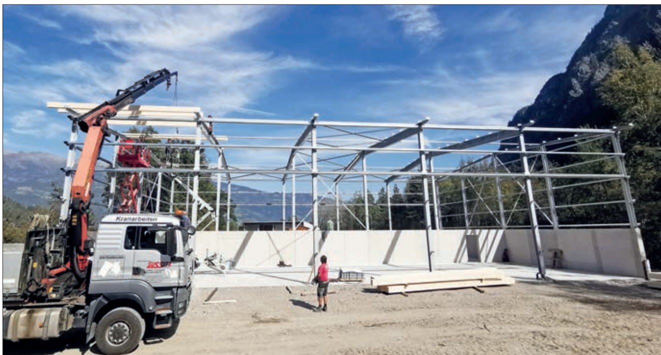
Neubau der Bauhoflagerhalle.

Über Ersuchen des Bürgermeisters berichtet der Obmann des Überprüfungsausschusses dem Gemeinderat auszugsweise aus dem Protokoll zur Sitzung des Überprüfungsaus-