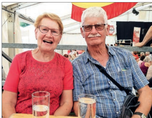
Landeswandertag in Inzing.

Jeweils am ersten Mittwoch des Monats um 14:30 Uhr findet das Monatstreffen der Ortsgruppe im Leisacher Hof statt.