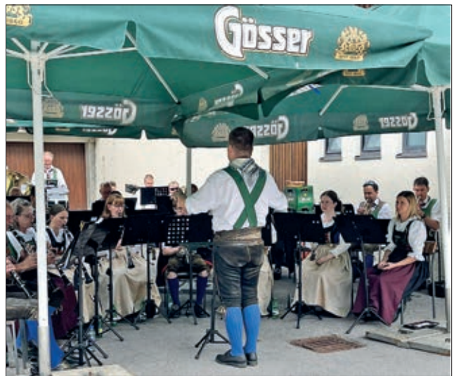
Pfarrkaffee, feiner Frühschoppen auf dem Gemeindeplatz.