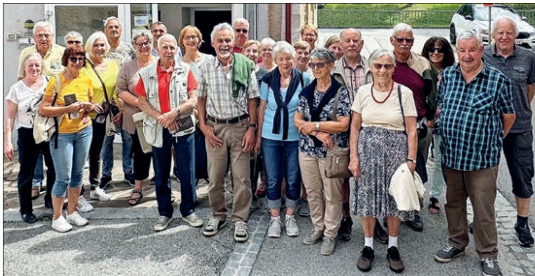
Ausflug nach Oberdrauburg.

samen Ausflug mit dem Ziel Oberdrauburg. Im Museum Vanni's Vogelwelt gibt es über 1.400 natur- und detailgetreu präparierte Vögel und auch andere Tiere aus allen Konti-