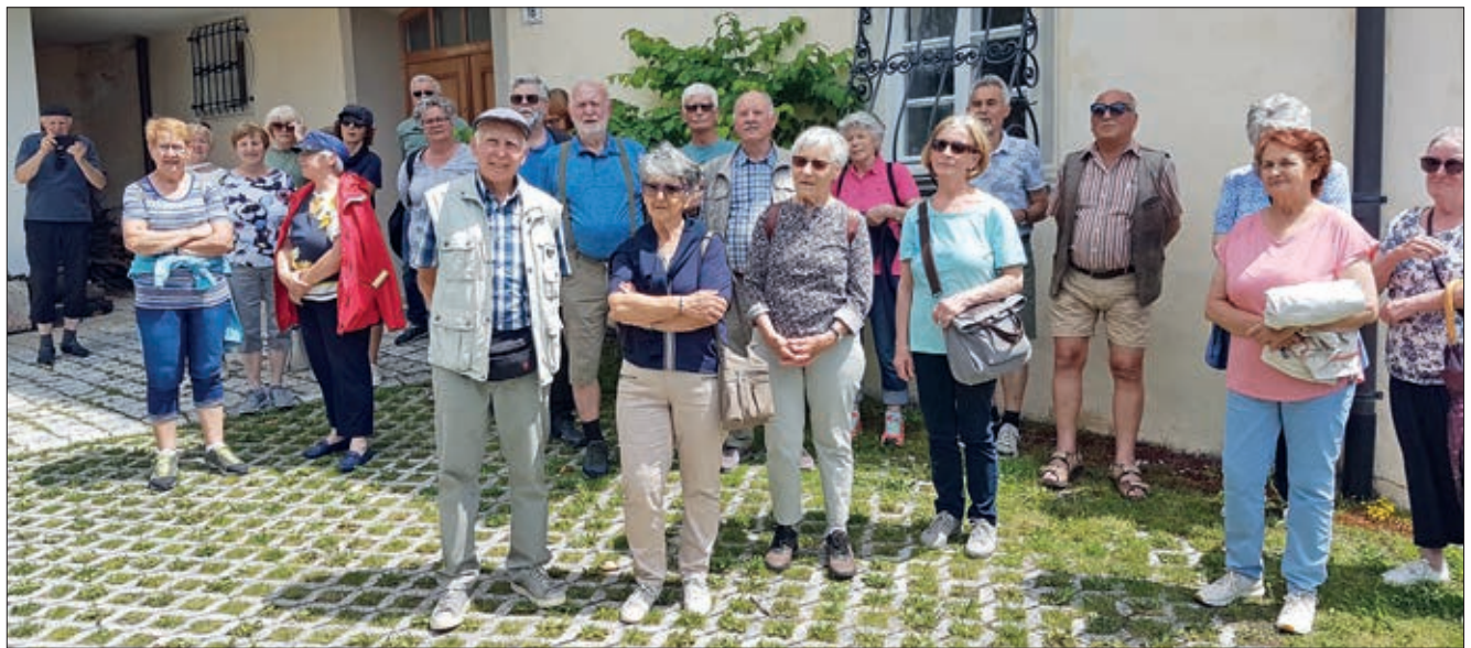
Leisach lernt Dölsach kennen.

über den wirtschaftlichen Aufschwung, den Dölsach vor allem durch den Bau der Südbahnstrecke und später der Felbertauernstraße erfuhr. Dadurch entstanden viele Betriebe, die teils weit über Osttirol hinaus bekannt sind, wie zum Beispiel die Dölsacher Kirchturmdecker. Von Bedeutung für die gesamte Region ist auch das große Klärwerk, das seit 1984 die Abwässer von 15 Gemeinden sammelt und reinigt. Zum Abschluss des informativen Rundgangs wurden die Leisacher Gäste zu einer gemütlichen Kaffeepause in die Seniorenstube der Gemeinde eingeladen.