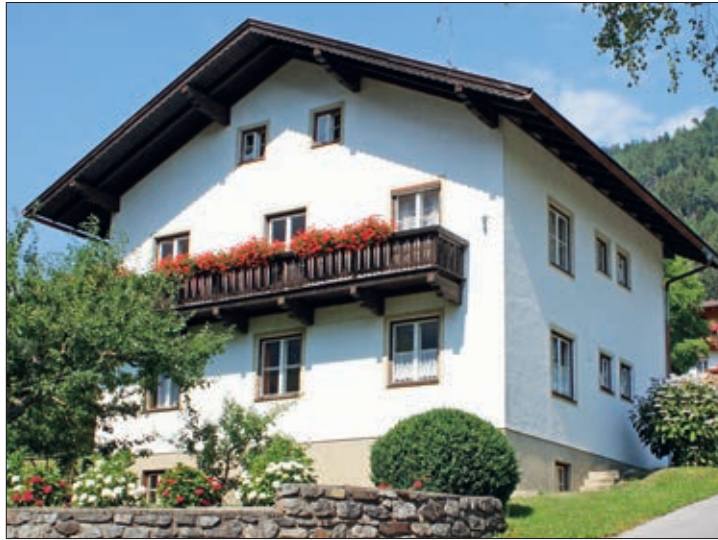
Aus alt, mach Neu – das Gloserhaus, Leisach Nr. 25