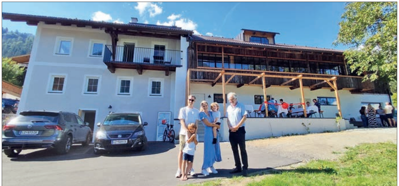
Am 2. September wurde pünktlich zum Dolomitenmann fertiggestellt!