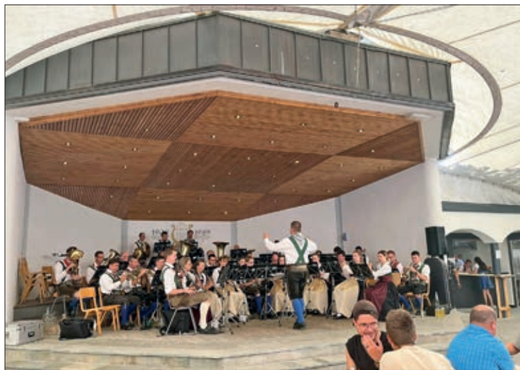
Tolles Konzert in Lappach, Südtirol.

Die Konzertsaison beendeten wir mit dem jährlich stattfindenden Hauptplatzkonzert und dem letzten Frühschoppen beim Leisacherwirt. Text: Michael Senfter