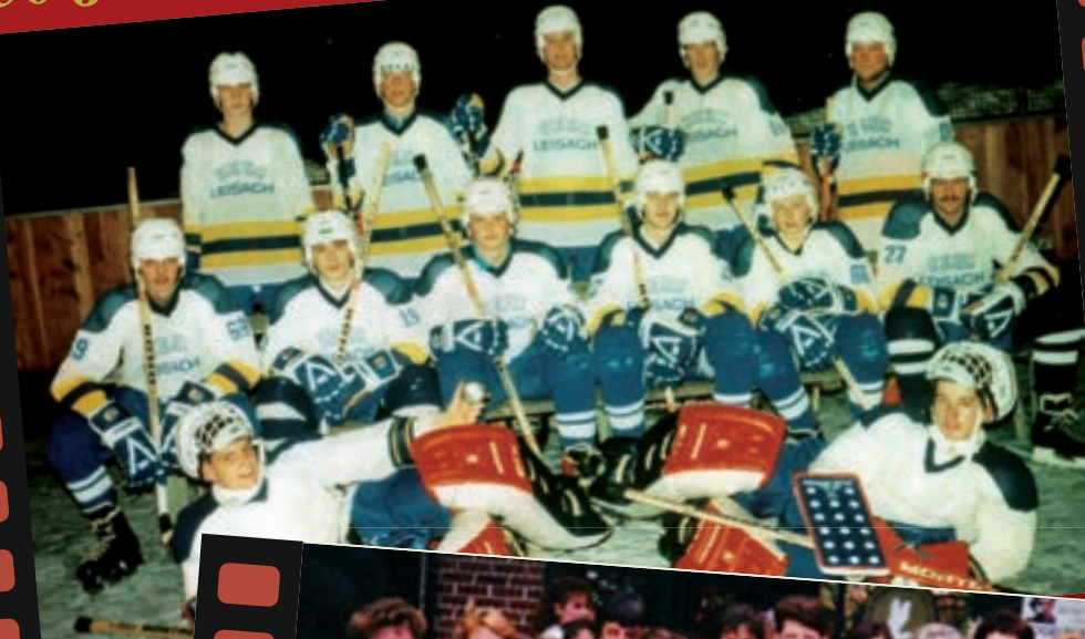
Mannschafts- foto UEC Leisach 1987