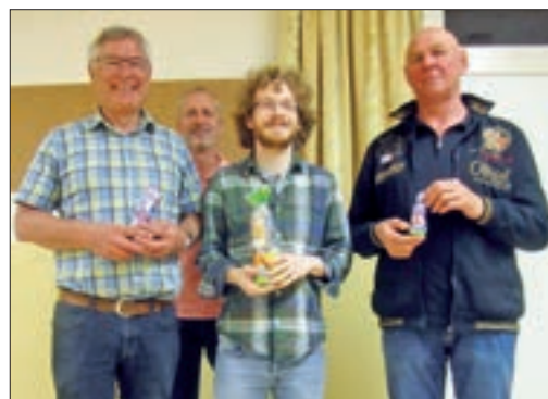
Blitz-Sieger mit den symbolischen Preisen