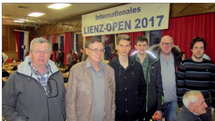
Die Leisacher Teilnehmer am Lienz Open