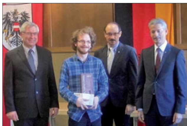
Sieger Gruppe „B“