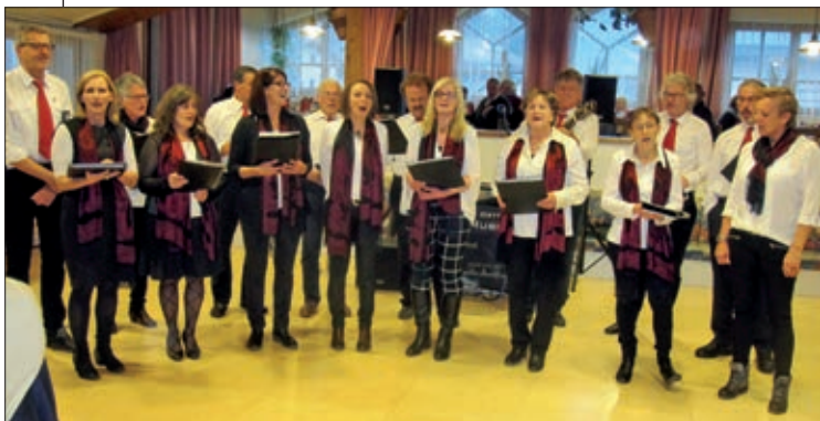
Singkreis Leisach bei der Bez. Weihnachtsfeier