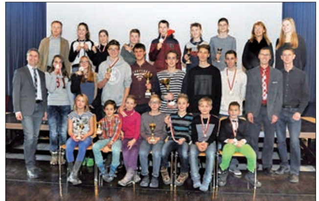
Die Gesamtsieger des Weihnachtsturniers im Gymnasium Lienz

Zum Jahresende organisierte unser Verein ein Schnellschachturnier in Leisach. Sieben Run-