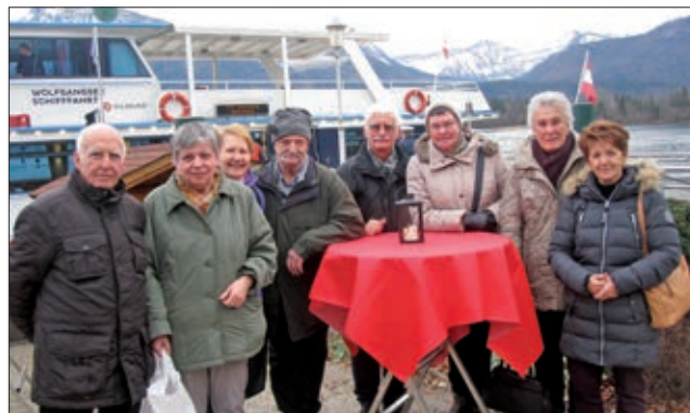
Advent am Wolfgangsee