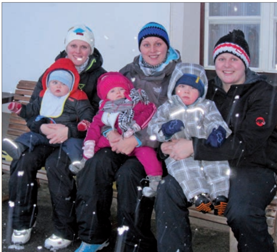
Bachler Gitschn mit Nachwuchs.