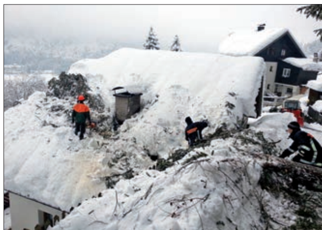
Die Freiwillige Feuerwehr war auch bei den starken Schneefällen im Einsatz.

Atemschutzleistungsabzeichen in Lienz: 22. März Trainingsbewerb Lienz West: 24. Mai