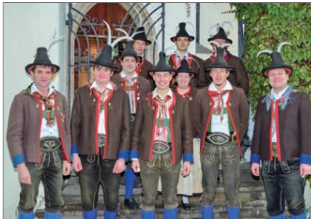
Der neue Vorstand der Musikkapelle Leisach.