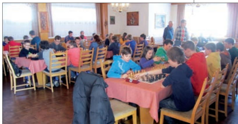
Die Kinder beim Karnischen Jugendcup in Kötschach-Mauthen.