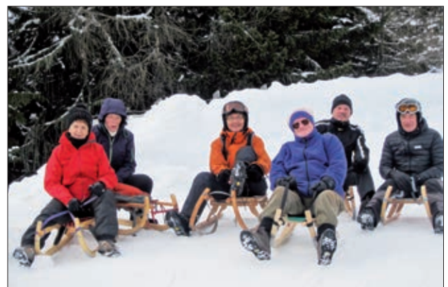
Rodeln Schöne Aussicht.