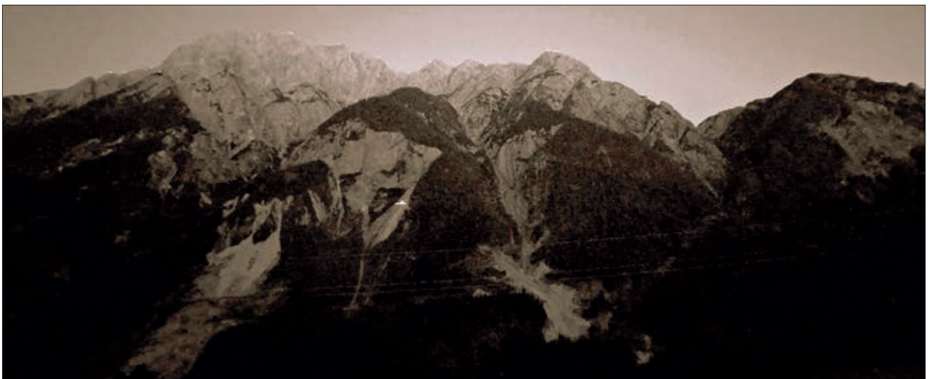
Herz-Jesu-Feuer 2025/Gemeinde Leisach

aufgeschreckt und zugleich nachdenklich gemacht. Solche Ereignisse zeigen, wie eng äußere Eindrücke mit unseren inneren Empfindungen verbunden sind – und wie verletzlich unsere Gemeinschaft manchmal wirkt.