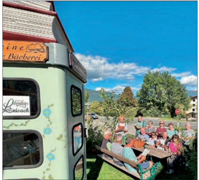
Septembertreff mit Lesestunde bei der „Kleinen Gemeindebücherei“.

Beim Landeswandertag des Pensionistenverbands in Langkampfen am 2. August 2025