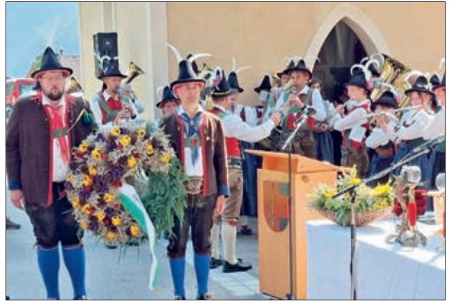
Kranzniederlegung am 15. August.