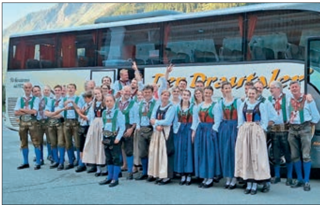
Fahrt nach Fieberbrunn.

Am 15. August reisten wir nach Kals am Großglockner, wo wir nach einigen