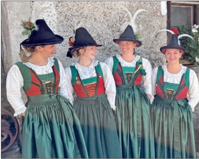
Marketenderinnen der Hauger Schützenkompanie.