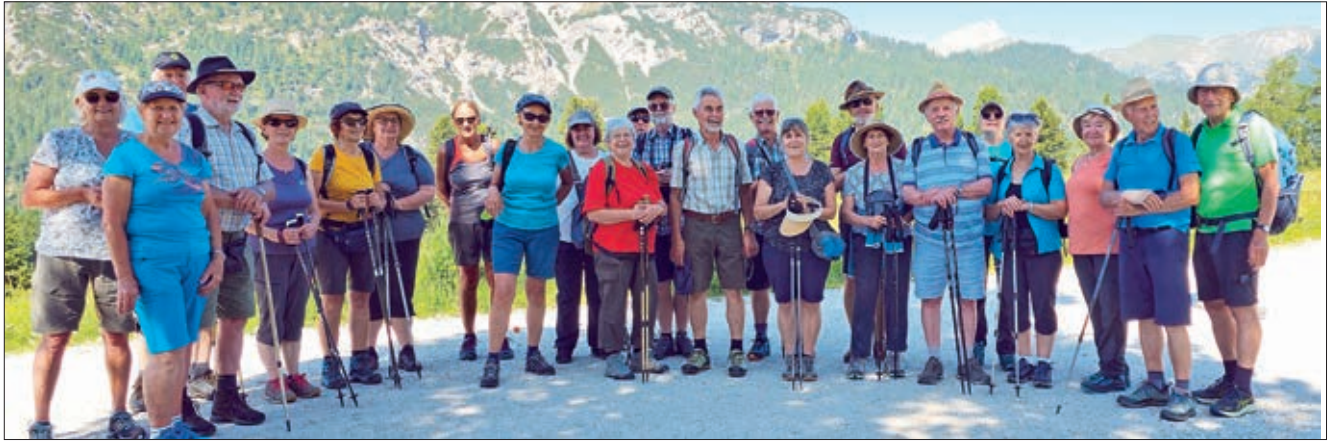
Die Wandergruppe auf der Plätzwiese.