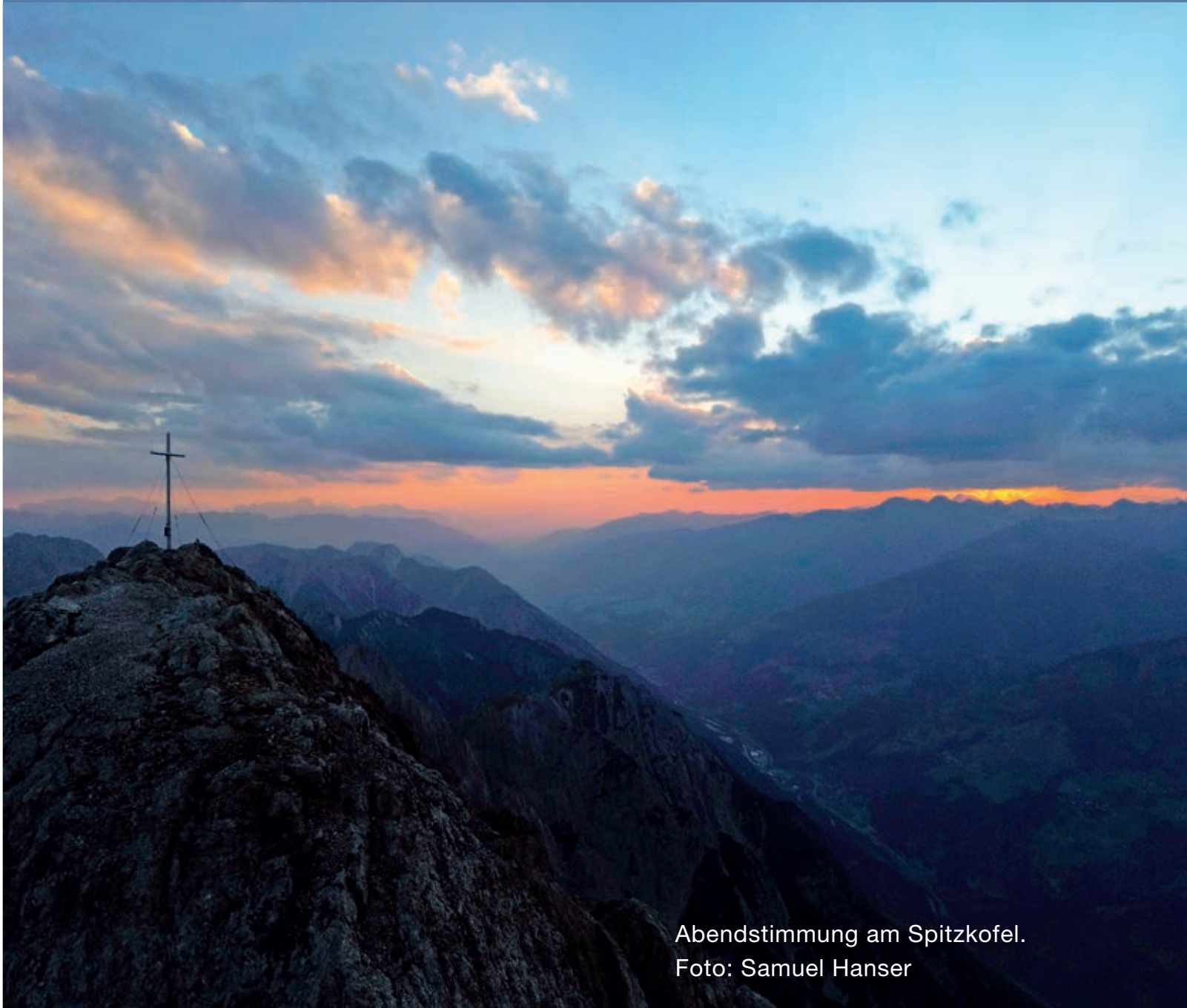
Abendstimmung am Spitzkofel.