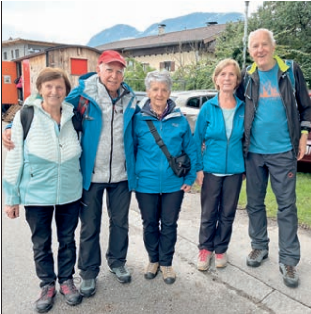
Beim Landeswandertag in Langkampfen.