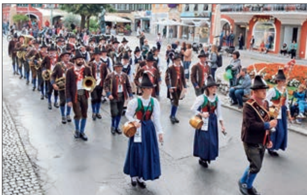
Aufmarsch zum Hauptplatzkonzert