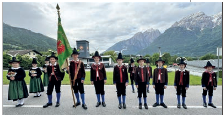
Leisacher Jungschützen.

Am 2. Juni 2024 fand das Bataillonsfest des Schützenbataillons Lienzer Talboden in Döl- sach statt. Bereits um 8:30 Uhr traf sich die Hauger Schützenkompanie samt Jungschützen zur Meldung und Frontabschreitung. Nach der Feldmesse fand mit der Defilierung der Höhepunkt des Tages statt. Text: Antonia Hirn