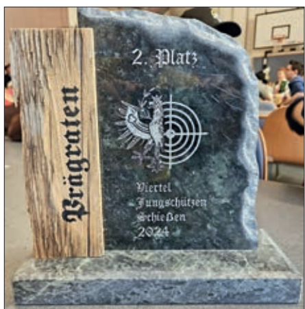
Zweiter Platz Mannschaftswertung Jungschützenschießen Prägraten.