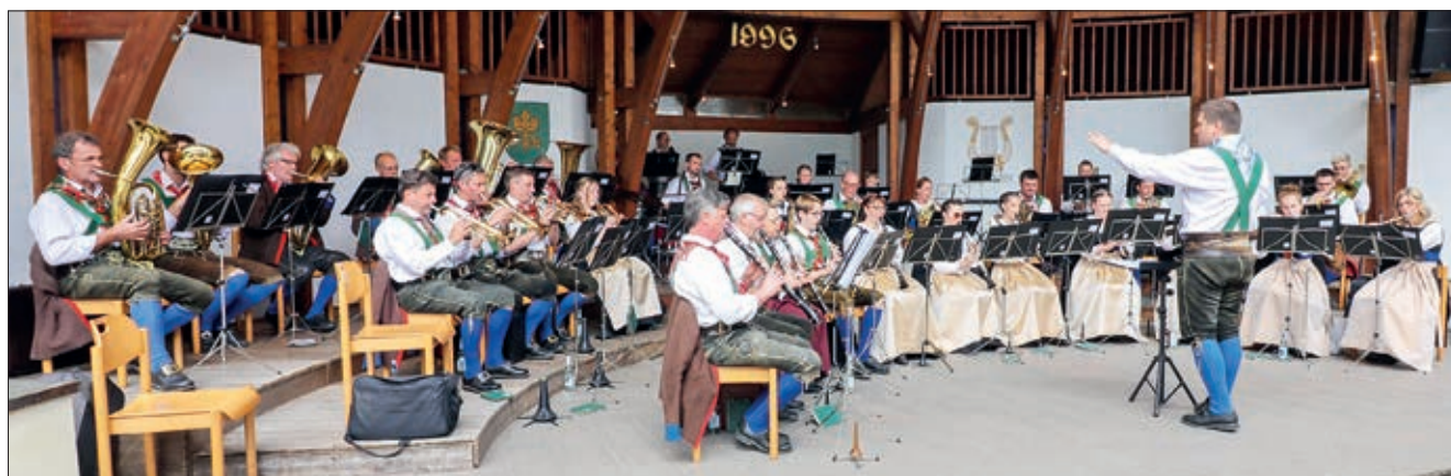
Konzert in Hopfgarten i. Def. beim Kirchtag.

Text: Michael Senfter