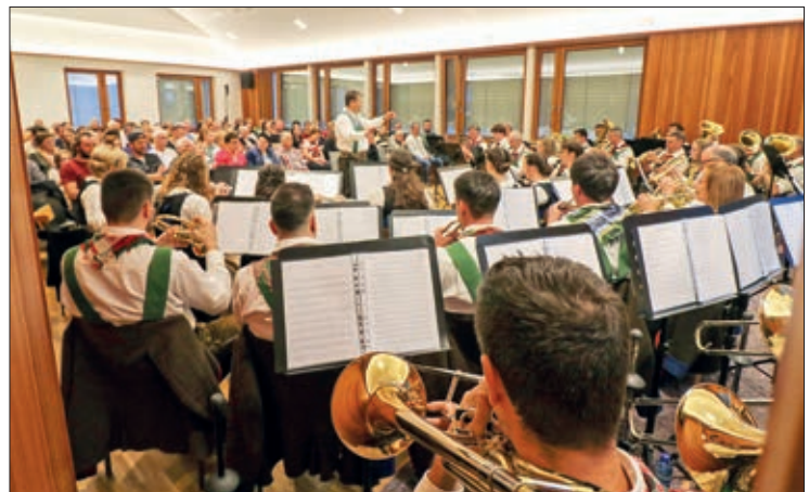
Volles Haus beim Frühjahrskonzert.