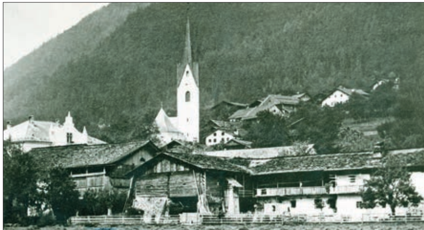
Der Müllerhof in Leisach.

schon ausgezogen und hatten zum Teil auch schon eigene Familien gegründet. Bedingt durch den Abbruch unseres Wohnhauses mussten wir vorübergehend als Notquartier in die Dapra-Säge umziehen. Als Ablöse und als Entgegenkommen seitens der Fa. Dapra, die ja Eigentümer des Müllerhofes war, erhielt unser Vater das sogenannte „Leitl“, ein Grundstück von ca. 1.000 m 2 , um dort ein Eigenheim zu errichten. Mit gro-