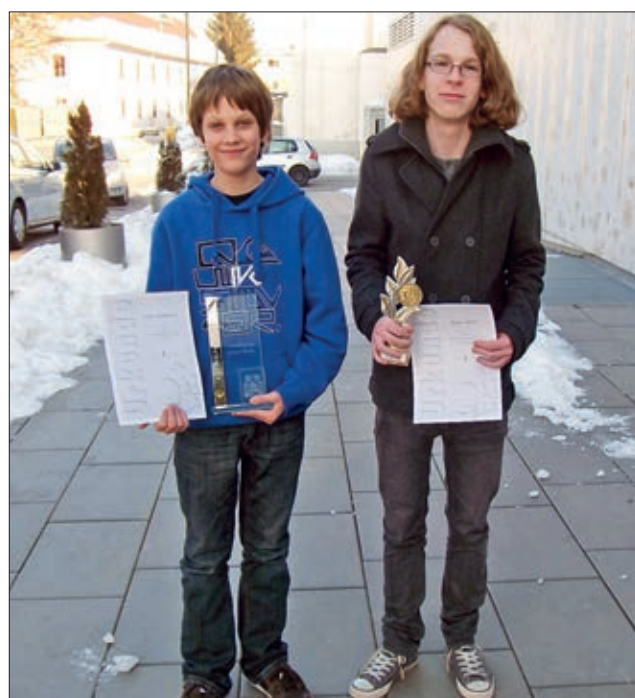
Landesmeister U 12, 2011.