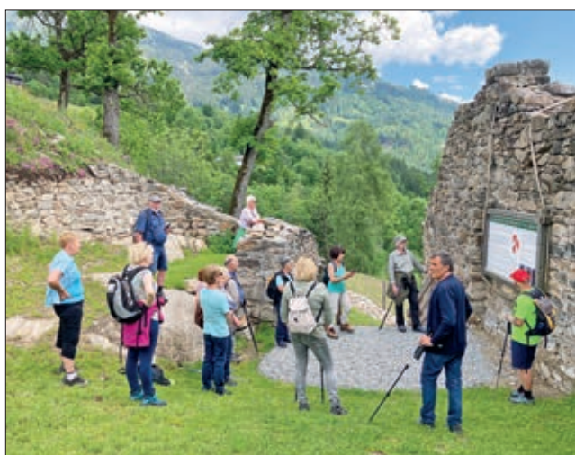
Wanderung von Stronach zur Ruine Walchenstein.