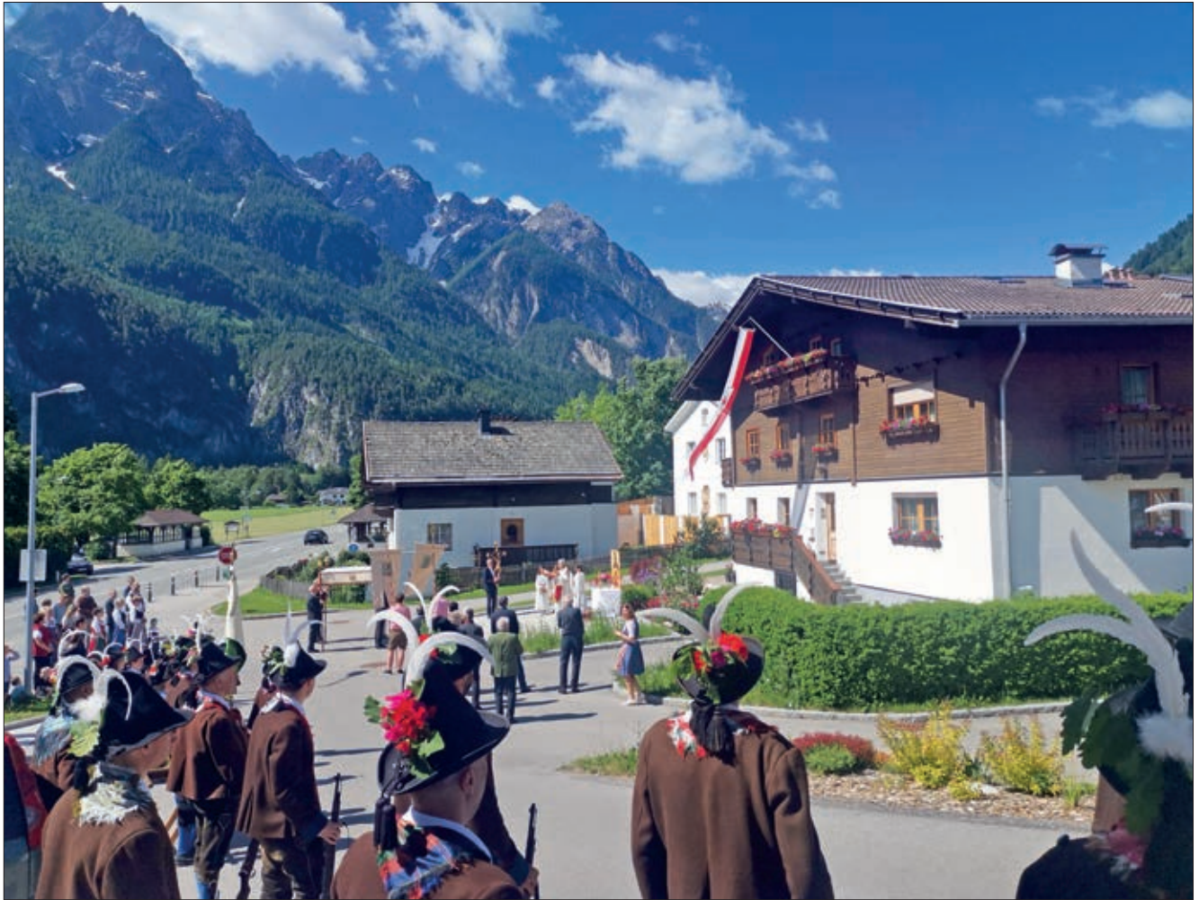
Herz-Jesu-Prozession am 13. Juni 2021.

dem nächsten gekannt hatte, aber seinen Lebensweg in fremde Hände legen musste. Den Tod eines so jungen Menschen zu akzeptieren, ist schwer, und unsere Gedanken sind bei seiner Familie.