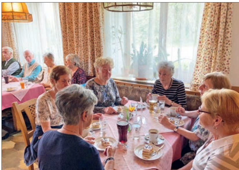
Erstes Treffen nach Corona-Erleichterung.

Beim Monatstreffen werden die nächsten Unternehmungen geplant, wie die Ausflüge der Wandergruppe im Sommer und Herbst.