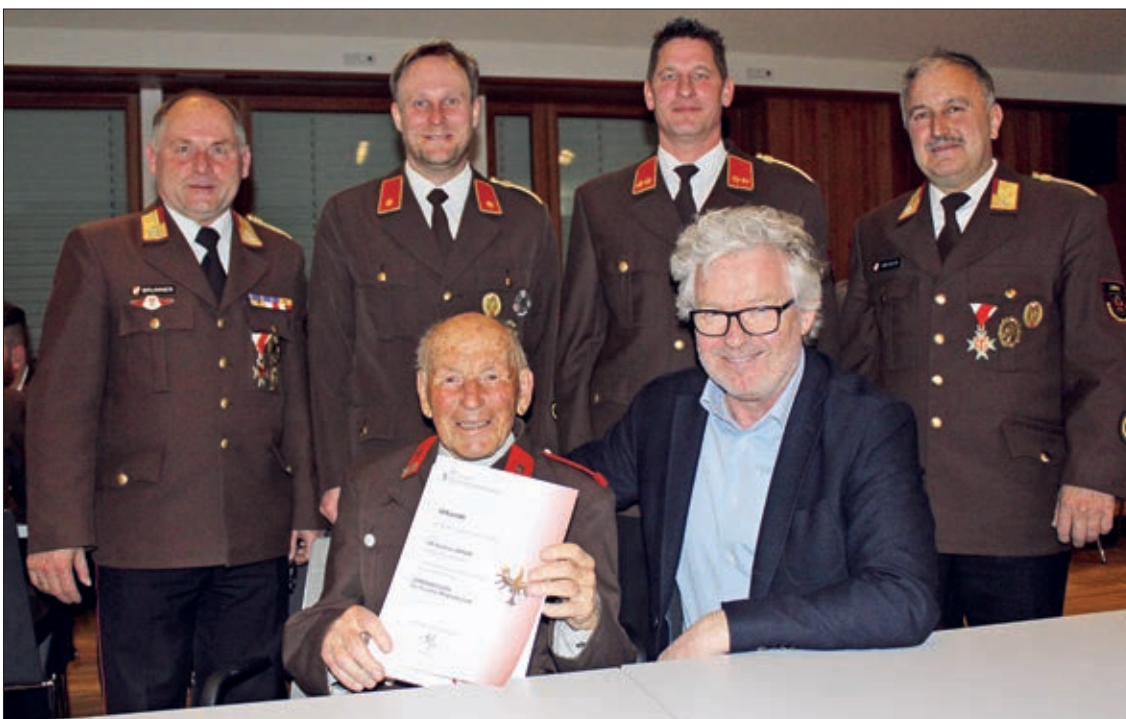
▲ Die neuen Feuerwehrmänner