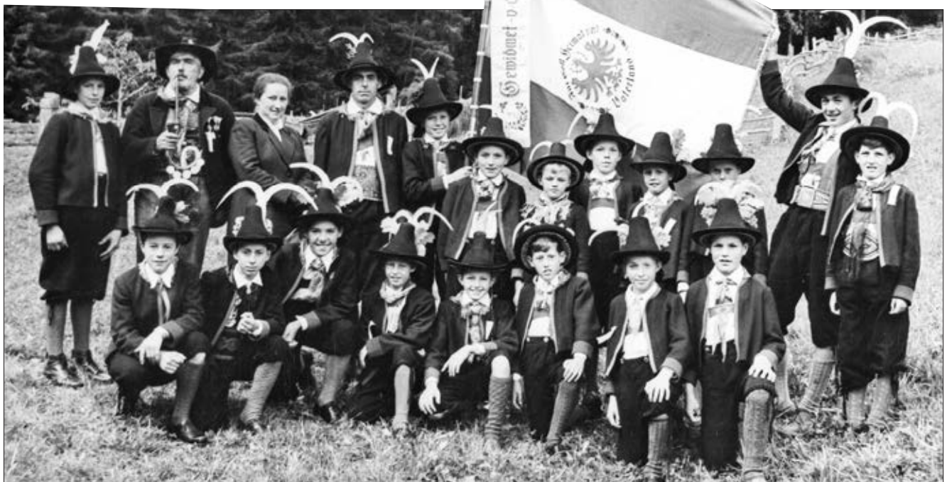
Die Hauger Jungschützen 1957 bei der Jungschützen-Fahnenweihe in der Lienzer Klause

Als Mitinitiator richte ich mich jetzt an alle, die einmal bei den Haugen Jungschützen waren und sich gerne daran erinnern. Wir würden uns freuen, über Erlebnisse, bleibende Erinnerungen oder erwähnenswerte Erfolge und Berichte im Zusammenhang mit der Mitgliedschaft der Hauger Jungschützen zu erfahren, egal ob Jahrgang 1939. Dieser war laut Mitgliederbuch der erste der Leisacher Jungschützen oder Jahrgang 2011, der derzeit jüngste der Leisacher Jungschützen. Jede noch so kleine Erinnerung ist für mich/uns interessant und wird die Chronik zu einem Vorzeigeprojekt in Osttirol machen.